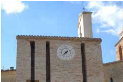
Candelara, torre dell'orologio

PESARO - Sabato 26 febbraio, a Candelara, alle ore 10.30 si terrà la cerimonia di inaugurazione per il completamento del restauro della cinta muraria, della sala del Consiglio e della torre dell orologio.