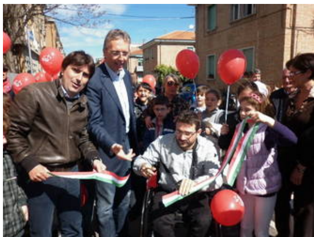
Il taglio del nastro in via Ugolini

Il 20 aprile si è tenuta l'inaugurazione del nuovo marciapiede di via Ugolini. Il percorso è stato realizzato su un lato del viale alberato che collega piazza Redi alla chiesa di Santa Maria di Loreto. Parte dell'intervento è stato finanziato con risorse europee gestite dalla Provincia, per un progetto sulla mobilità pedonale casa-scuola, nell'ambito del programma sulla conciliazione tempi di vita e di lavoro.