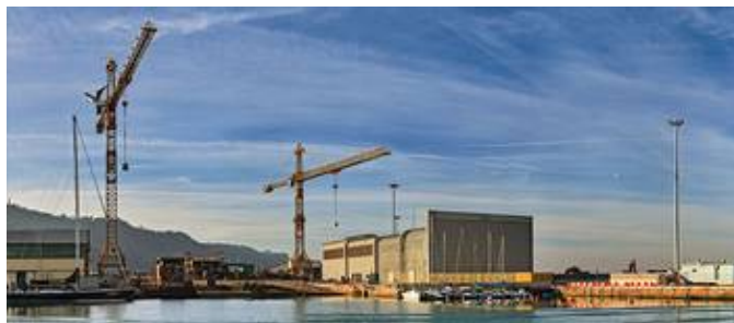
Veduta dell'ex cantiere navale

Avviato a marzo 2013 un concorso di progettazione che si concluderà il 13 e 14 luglio, con la regia di un gruppo di tecnici riuniti nella Young Architects Competitions (Yac) una società che gestirà varie esperienze di laboratorio urbano.