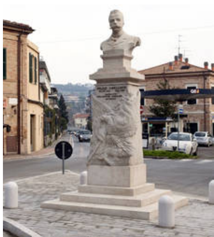
Il monumento a Felice Cavallotti

Al garibaldino Felice Cavallotti (1842-1898) venne realizzato un busto ai tempi del sindaco Tombesi (1910). Dopo alterne vicende, il monumento è stato riassembleto e restaurato grazie al contributo della Bcc di Gradara, e collocato all'incrocio tra via Cialdini e via Cavallotti, riqualificando uno spazio urbano molto frequentato.