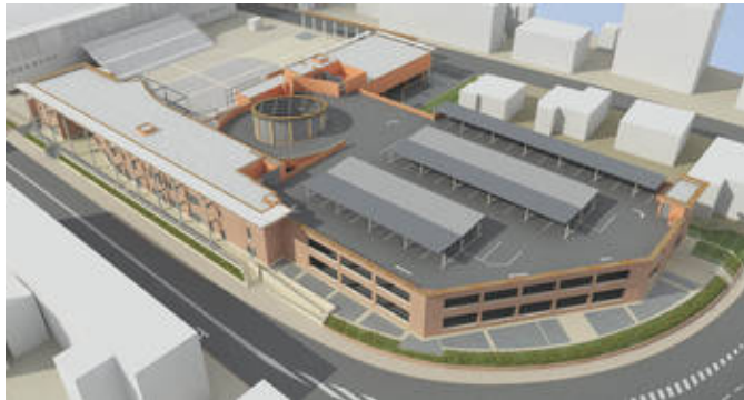
Il rendering del "Curvone"